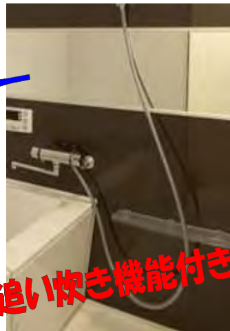
追い炊き機能付き!!