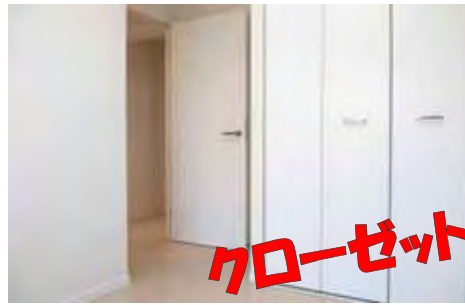
クローゼット付き洋室