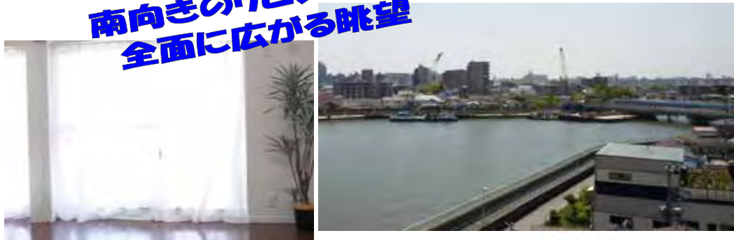
南向きのリビングから 全面に広がる眺望